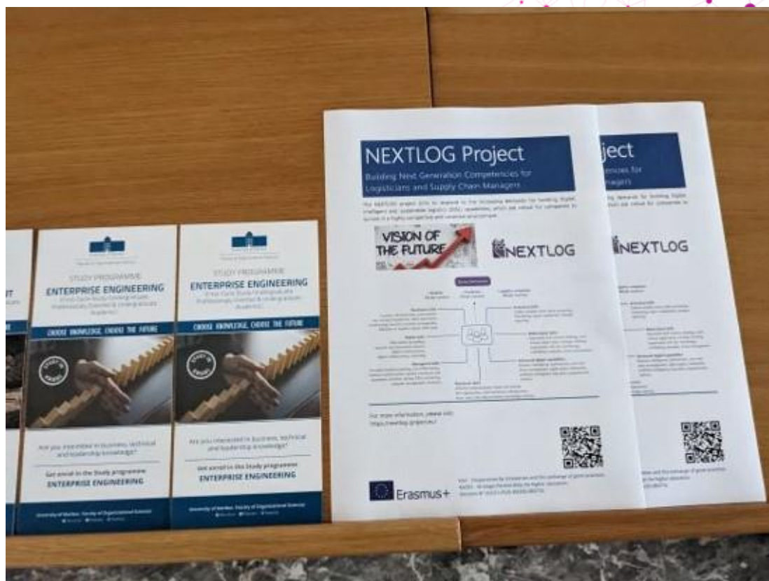
Rysunek 2. Wydarzenie upowszechniające – University w Mariborze

14 września 2022 roku Uniwersytet w Mariborze, dokładniej Wydział Nauk Organizacyjnych, zorganizował wydarzenie upowszechniające w celu podzielenia się intelektualnymi wynikami projektu z liczną międzynarodową publicznością. W połączeniu z II Międzynarodową Szkołą Letnią pt. „Organizacja, Zarządzanie i Społeczeństwo”, przedstawione oraz omówione z publicznością zostały wyniki projektu NEXTLOG.