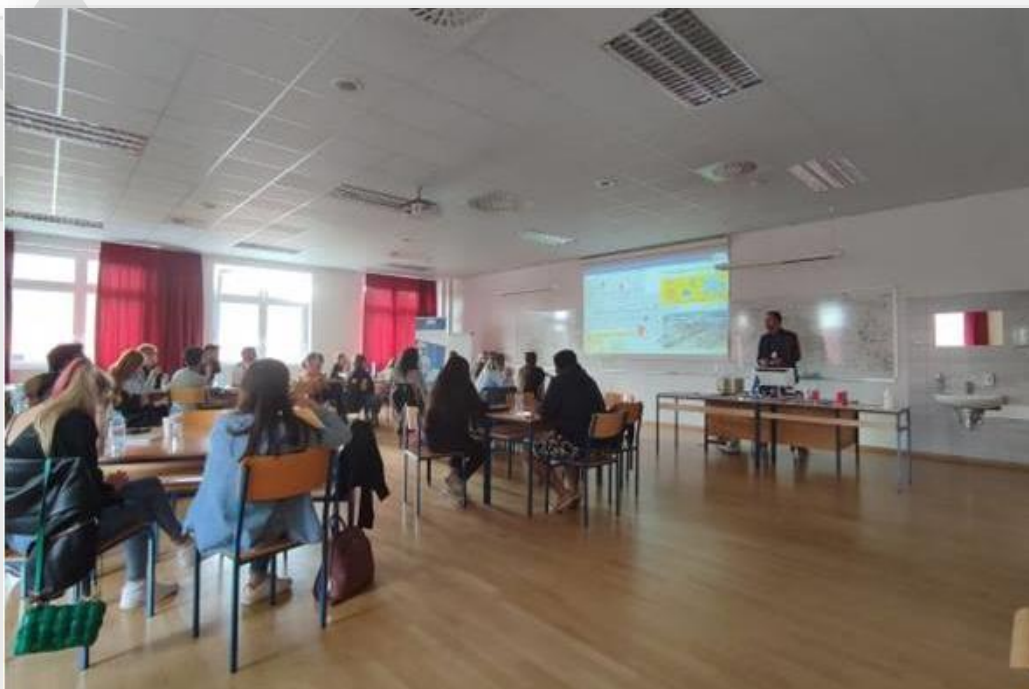
Φώτο 3. Multiplier εκδήλωση – Πανεπιστήμιο του Maribor.

για το ότι οι στρατηγικές DISL αποτελούν θετικά εργαλεία για την μακροπρόθεσμη επιτυχία μιας επιχείρησης, ειδικότερα εάν, όπως έχει τονιστεί από τον τομέα 'Διαχείρισης Περιουσιακών Στοιχείων', υιοθετηθεί μια ενοποιημένη και ολιστική προσέγγιση.