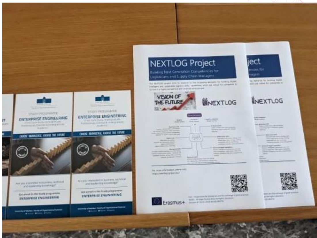
Φώτο 2. Multiplier εκδήλωση – Πανεπιστήμιο του Maribor.

Στις 14 Σεπτεμβρίου 2022, πραγματοποιήθηκε μια multiplier εκδήλωση από το Πανεπιστήμιο του Maribor - Faculty of Organizational Sciences (εταίροι του έργου NEXTLOG), ώστε να μοιραστούν τα θεωρητικά αποτελέσματα του έργου με ένα πολυάριθμο διεθνές κοινό. Αντίστοιχα, σε συνδυασμό με το 2 ο International Summer School «Organization, Management and Society», τα αποτελέσματα του έργου NEXTLOG παρουσιάστηκαν και συζητήθηκαν με το κοινό.