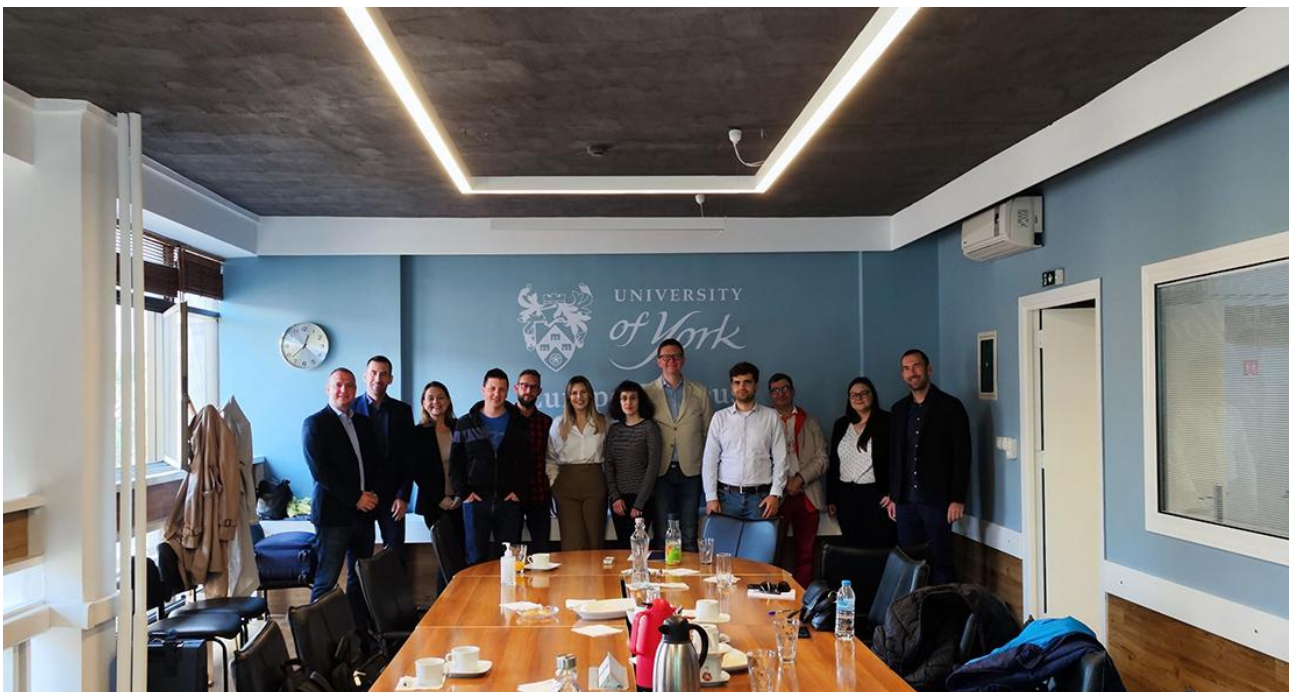
Φώτο 1. Οι εταίροι του NEXTLOG στην συνάντηση του έργου στη Θεσσαλονίκη.

Οι εταίροι συζήτησαν επίσης τις υπόλοιπες multiplier εκδηλώσεις που είχαν προγραμματιστεί για τον Νοέμβριο του 2022.