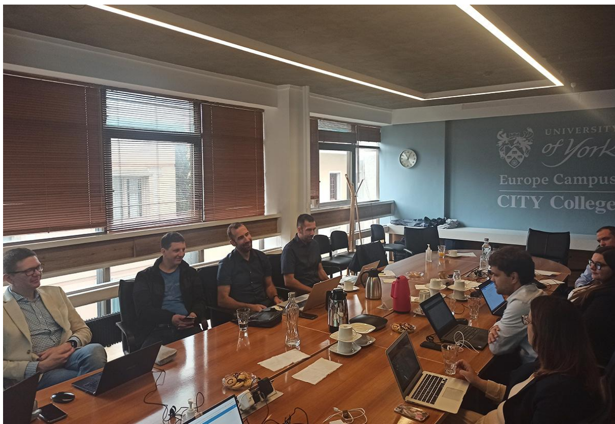
Φωτο 2. Οι εταίροι του NEXTLOG κατά την διάρκεια της συνάντησης του έργου στη Θεσσαλονίκη.