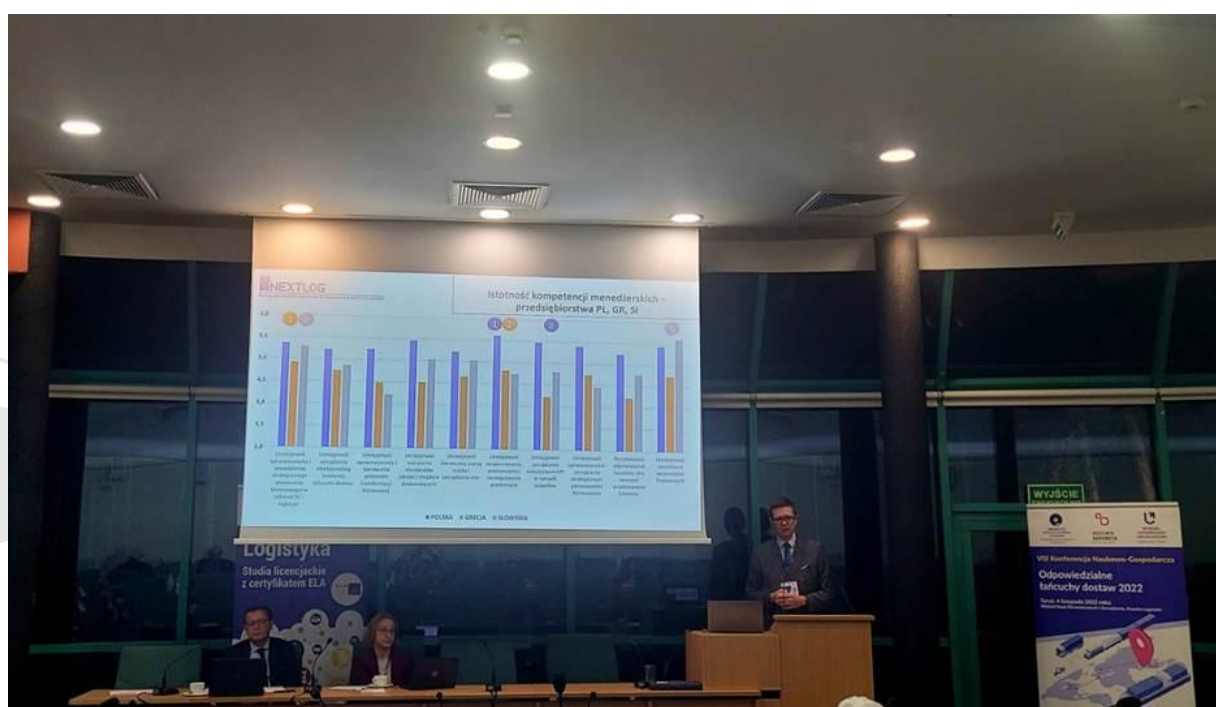
Slika 4. Udeležba Univerze UoL na konferenci "Odgovorne dobavne verige" v Torunu, 2022.

Zanimanje za dostop do teh gradiv v virtualnem učnem okolju je bilo izredno veliko.