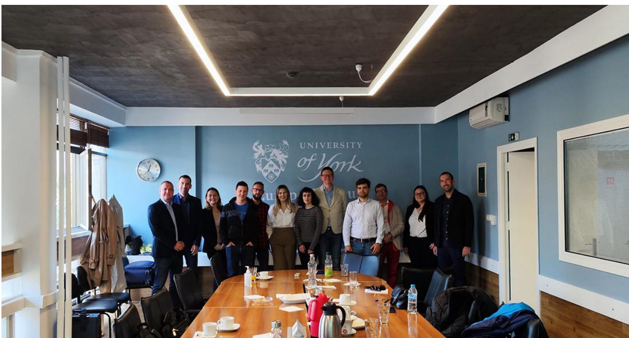
Slika 1. Partnerji projekta NEXTLOG v Solunu.

Vsak partner bo pripravil tudi videoposnetke okolja za e-učenje. Partnerji so razpravljali tudi o preostalih multiplikativnih dogodkih, ki so bili predvideni za mesec november 2022.