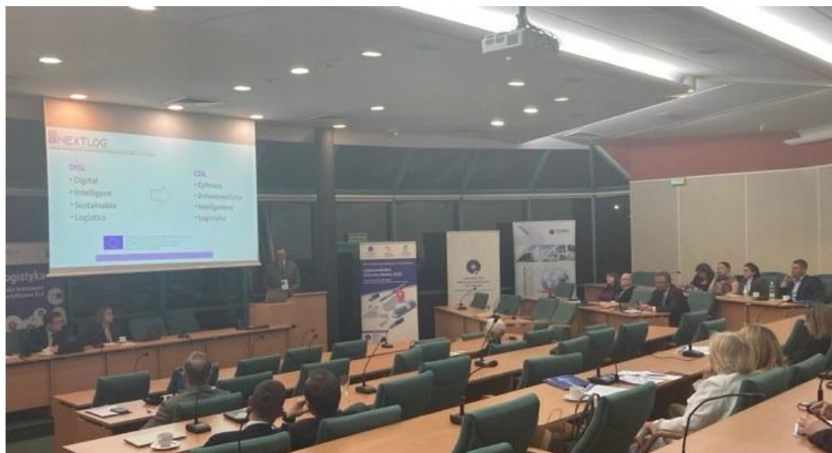
Slika 3. Udeležba UoL na konferenci o »Odgovornih dobavnih verigah« v Torunu, 2022.